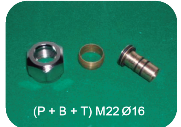
(P + B + T) M22 Ø16