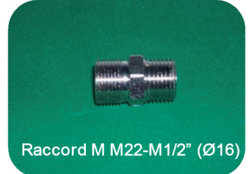
Raccord M M22-M1/2" (Ø16)