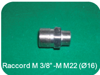
Raccord M 3/8" -M M22 (Ø16)