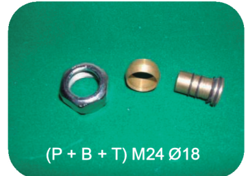
(P + B + T) M24 Ø18