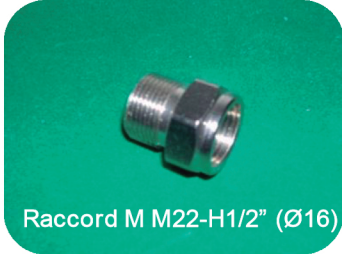
Raccord M M22-H1/2" (Ø16)

Tube multicouche TWIN-PIPE avec revêtement incorporé pour un tube ou double tube (Aller-retour) dans la même bobine