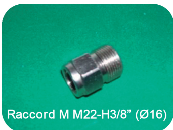
Raccord M M22-H3/8" (Ø16)